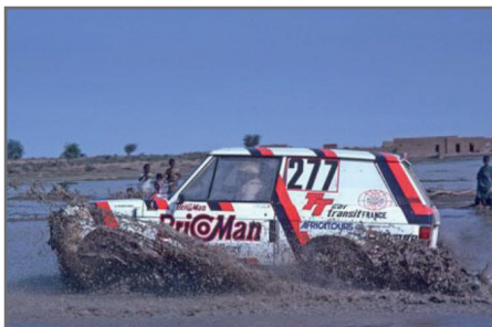
tijdens een Liège-Sofia-Liège